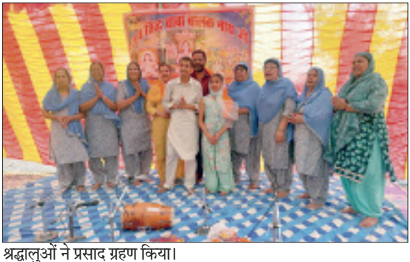
श्रद्धालुओं ने प्रसाद ग्रहण किया।