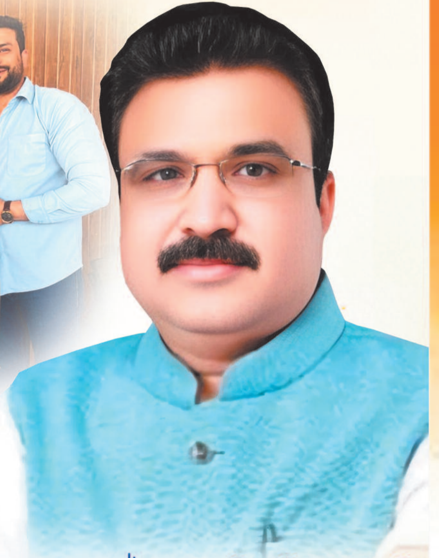
मान. द्वारिकाधीश यादव जी विधायक, खल्लारी विधानसभा अध्यक्ष, जिला कांग्रेस कमेटी महासमुंद