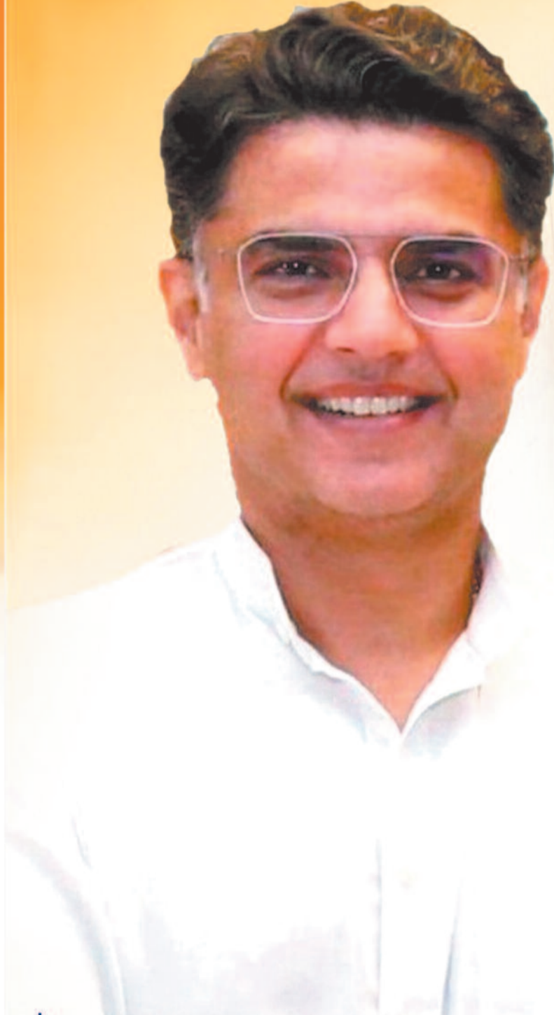
मान. सचिन पायलट जी प्रभारी, छत्तीसगढ़ कांग्रेस कमेटी