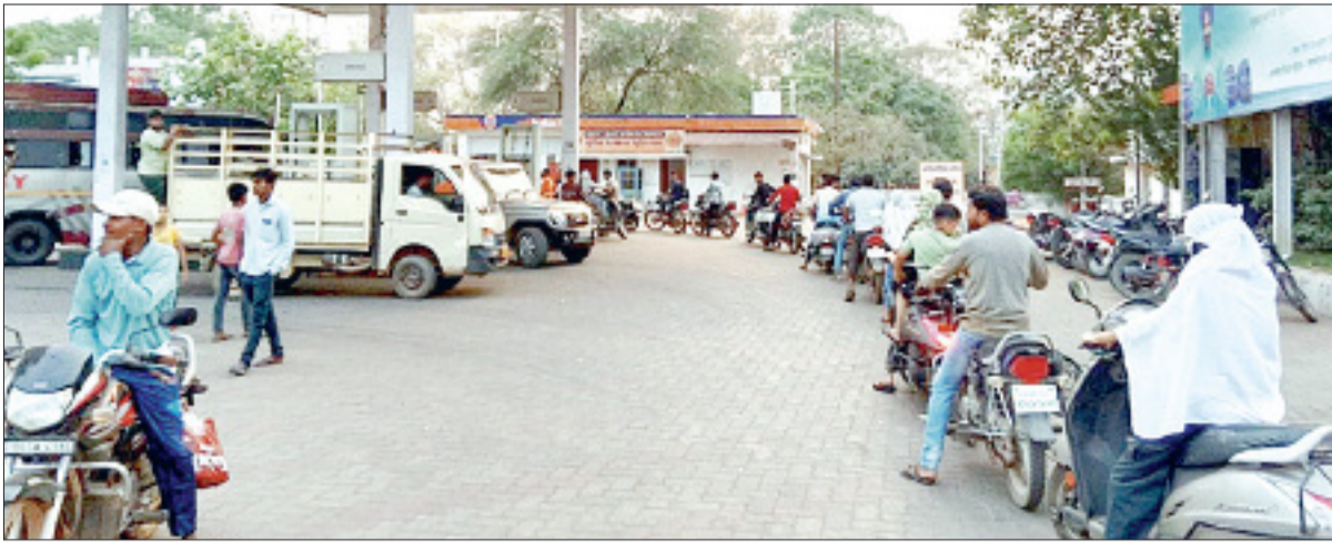
महासमुंद। बीते दिनों लोग एलपीजी सिलिंडर के लिए गैस एजेंसियों के सामने लाइन लगाते हुए नजर आ रहे थे। वहीं अब नगर के पेट्रोल पंप में भी वाहन चालकों की लंबी कतार देखी जा रही है। रविवार को यहां के कई पंपों में फ्यूल खत्म हो गया, जिसके चलते जिन पंपों में पेट्रोल-डीजल मिल रहे थे, वहां लोगों की भीड़ लगनी शुरू हो गई। सोमवार को भी यही स्थिति रही। फोटो दिखाई दे रही लोगों की लाइन नगर के पुलिस वेलफेयर पेट्रोल पंप की है।